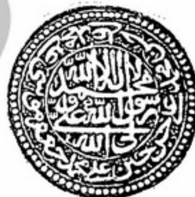
تصویر شماره (۲)