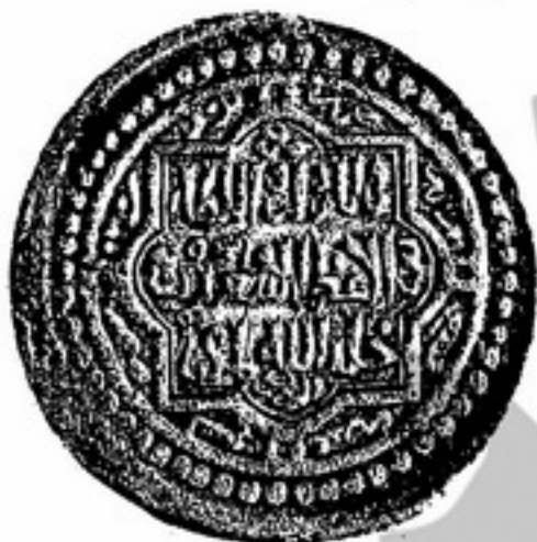
تصویر شماره (۱)

۸۶- با کارشناسی تصاویر زیر می‌توان گفت تصویر شماره ۱ ..... و تصویر شماره ۲ ..... است.